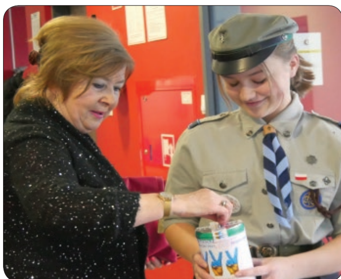
Przyjemne z pożytecznym - kwestujemy dla uchodźców