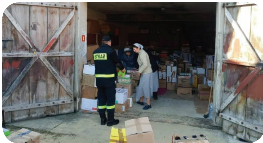
Szczercowscy strażacy dary zawieźli do Zamościa, stamtąd trafią na Ukrainę

A wojna na Ukrainie trwa już prawie dwa miesiące.