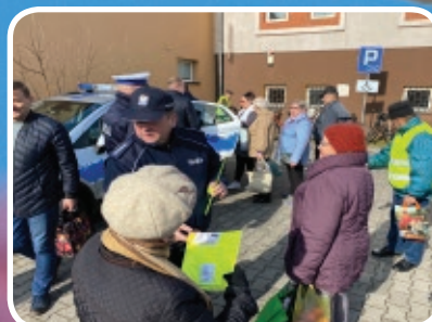
Dbamy o bezpieczeństwo na drogach