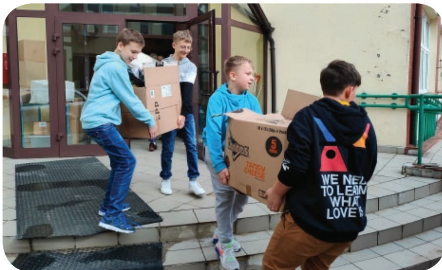
Zbiórki dla Ukrainy odbywały się także w szkołach