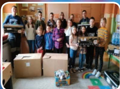
Cała Gmina pomaga Ukrainie