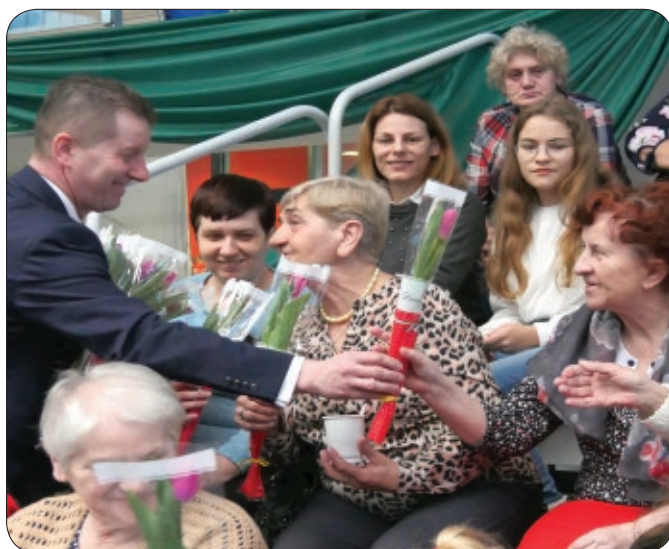
Panowie zadbali o kwiaty...