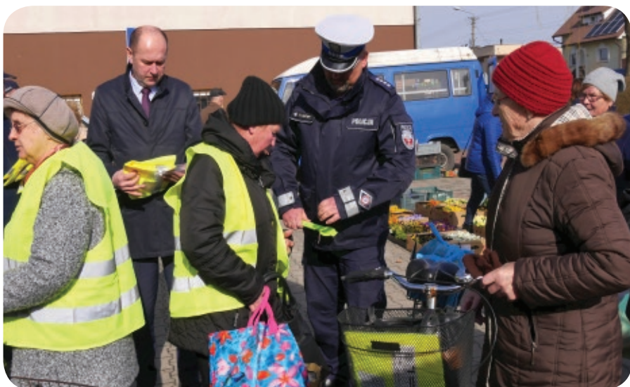
Przydatne prezenty uzupełniał krótki instruktaż policjanta