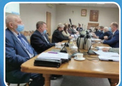
Rada za sterylizacją bezdomnych zwierząt