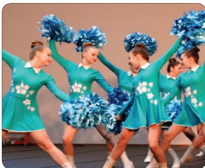
Mażoretki ze Strzelec Wielkich zrobili furorę!