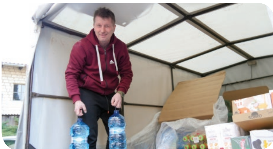
Woda butelkowana, odzież, żywność - potrzeba dosłownie wszystkiego!

- Zaczynamy od zapewnienia pobytu dla pięćdziesięciu osób, ale jesteśmy gotowi do zorganizowania opieki dla kolejnych grup – dodaje Wójt