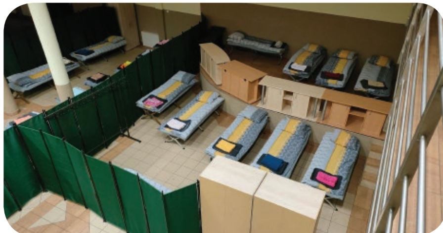
Sala w Osinach czeka gotowa na przyjęcie uchodźców