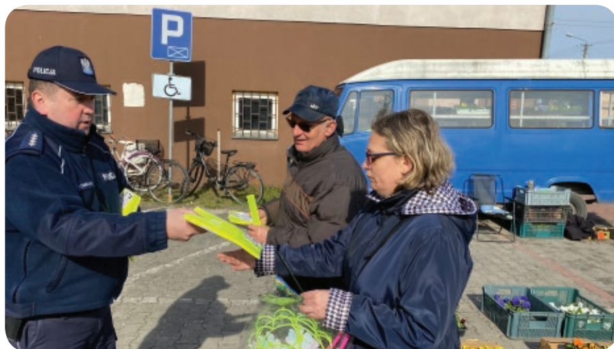
Rozdano ponad dwieście kamizelek, a do tego opaski i odblaskowe breloki

Policyjne działania miały na celu uświadomienie uczestnikom ruchu drogowego, że niezależnie od tego, czy na drodze jesteśmy pieszym, czy też kierującym, to sami musimy dbać o bezpieczeństwo.