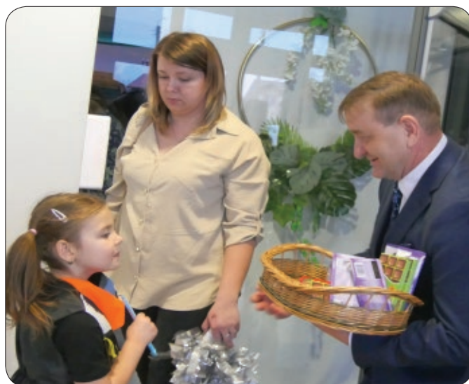
...oraz słodkie upominki dla wszystkich Pań!