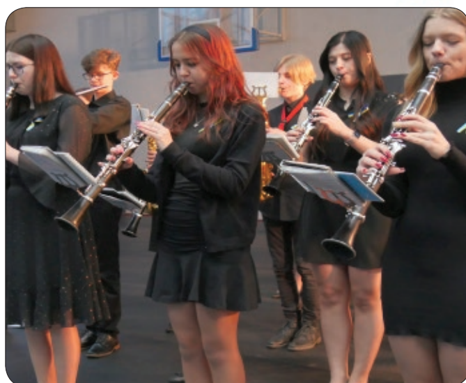
Orkiestra dęta OSP Szczerców - jak zawsze rewelacyjna!