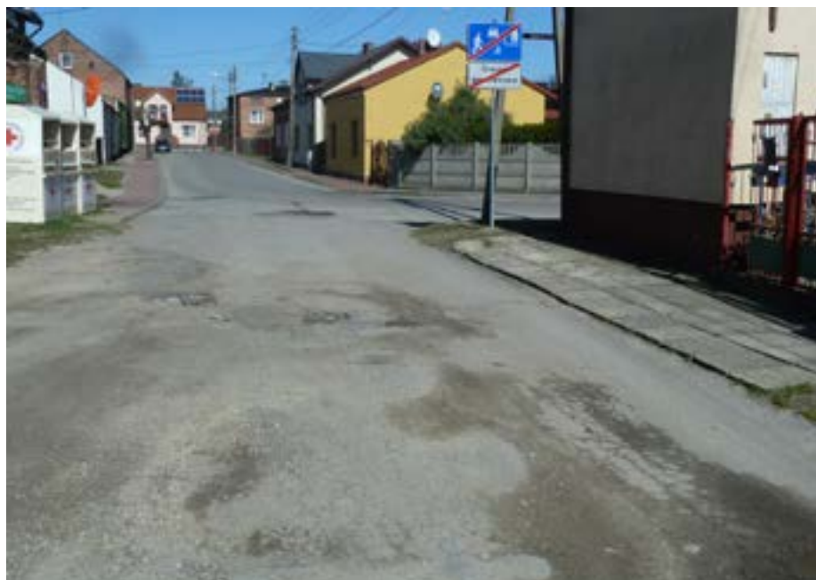
Ulica Żeromskiego zmieni się nie do poznania

K.K.: Rzeczywiście, to nie koniec, Gmina wybuduje tu jeszcze nową sieć wo-