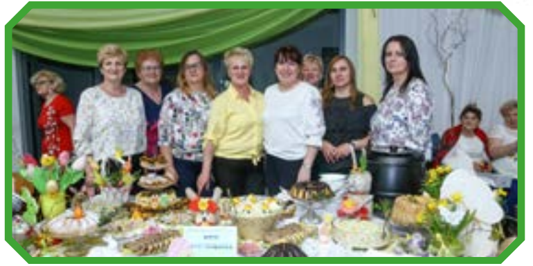
Koło Gospodyń Wiejskich Jastrzębice