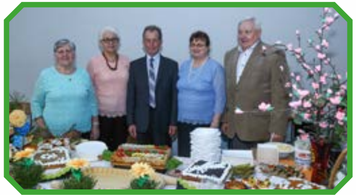
Stowarzyszenie Emerytów, Rencistów i Osób Pełnoletnich Gminy Szczerców