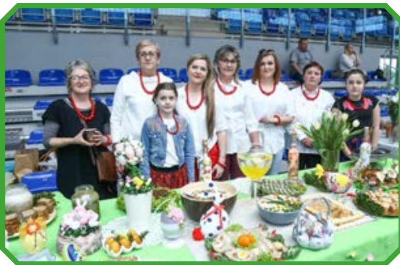
Koło Gospodyń Wiejskich Tatar