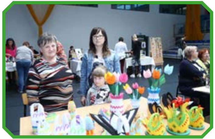
Stowarzyszenie Pozytywnie Zakręcone z Chabielic