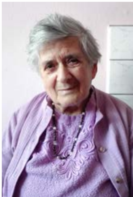
Najlepszą wiedzę o tradycjach mają nasi seniorzy