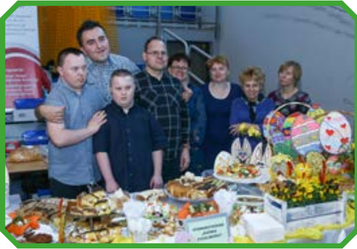
Stowarzyszenie Pomocy Osobom Niepełnosprawnym Kuźnia Życzliwości