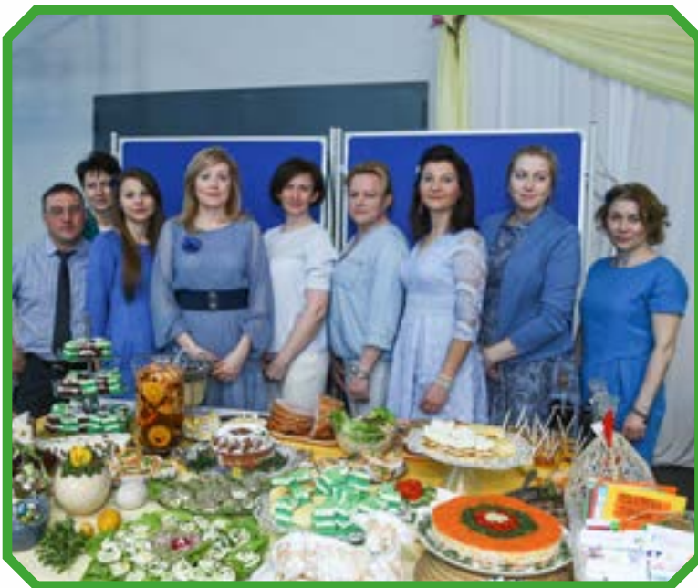
Stowarzyszenie Na skrzydłach marzeń