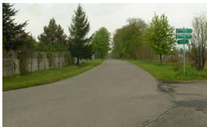
Fot: odcinek na którym powstanie nowe oświetlenie w m. Kieruzele