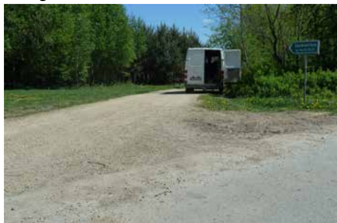
Fot: droga Szubienice