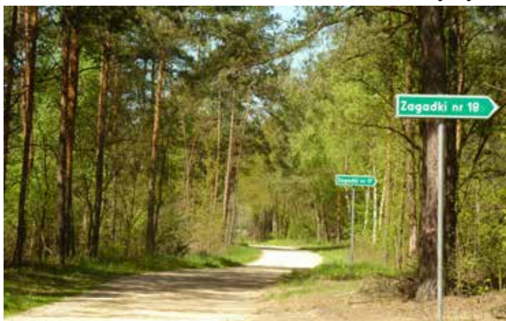
Fot: droga Zagadki