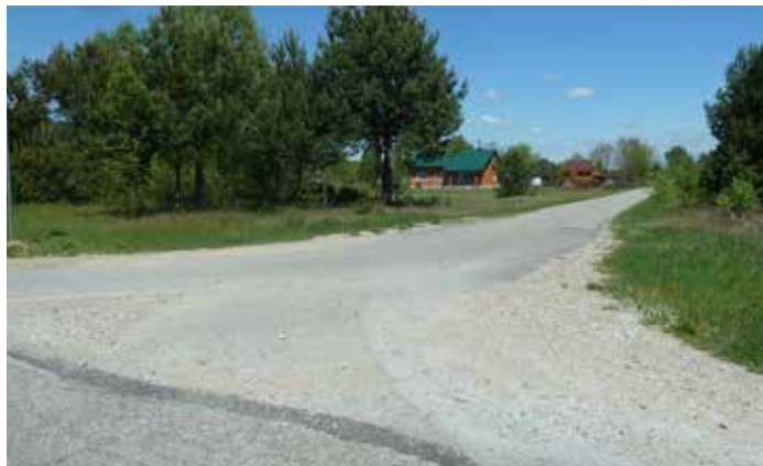
Fot: w Stanisławowie Drugim zaplanowano budowę nowego oświetlenia

W maju podpisano umowę na wykonanie oświetlenia ulicznego w miejscowościach Stanisławów Drugi, Kieruzele, Kozłówki. Wartość robót oszacowano na 134.103,60 zł. W ramach przedsięwzięcia na terenie Gminy Szczerców powstaną nowe nitki oświetlenia ulicznego o całkowitej długości 1250 mb. Zakończenie tej inwestycji zaplanowano na 31 lipca br.