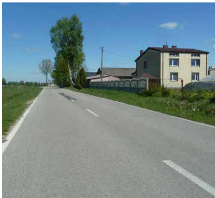
Fot: w Kozłówkach będą nowe lampy